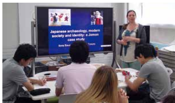
バウシュ講師による講義