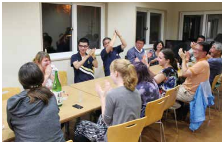
地元の方々との交流

プログラムの後半では北海道に移動し、人文社会系研究科の附属施設である常呂実習施設で北海道の歴史遺産を体験的に学んだ。常呂のプログラム中は施設に附属する学生宿舎に宿泊し、自炊もしながら課題に取り組み、受講者同士や参加スタッフ、そして地元北見市の支援者とも交流を深めた。プログラムの最後には各受講者がレポートを提出し、担当講師から修了証の授与が行われた。