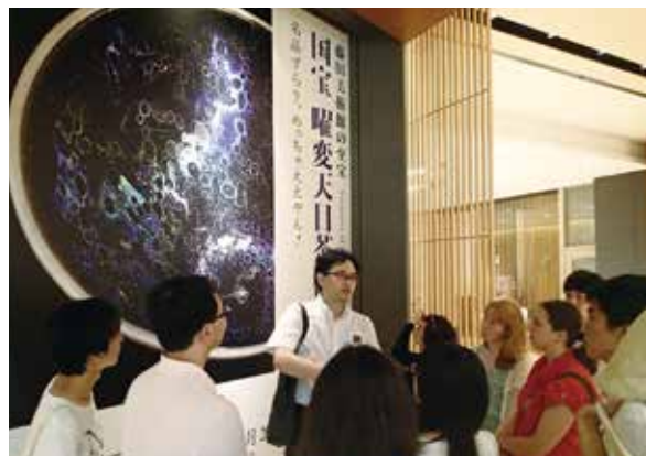
サントリー美術館