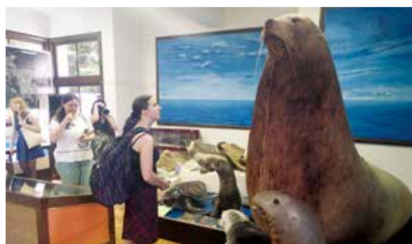
網走市郷土博物館