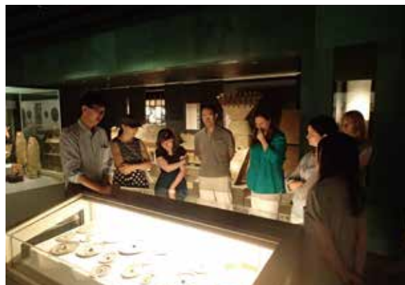
國學院大學博物館