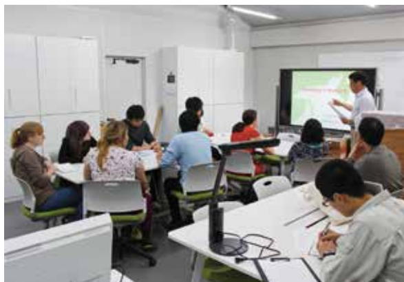
熊木講師による講義