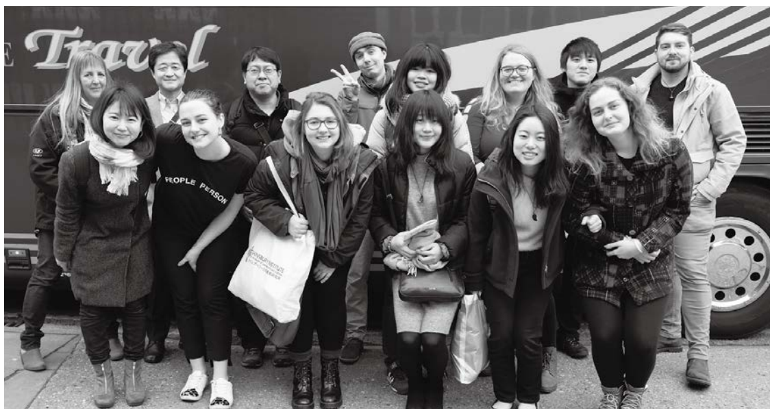
お別れ前の記念撮影。2週間にわたって寝食をともにした参加者たちの間には、国境を越えた絆が生まれた