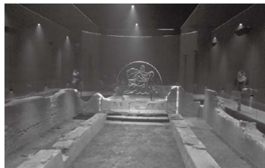
ミトラス神殿遺跡

However, the Latin chanting and music is an element that has not been proven to have been included in the Cult's practices- an almost singular criticism of the visit. Given the eagerness to use sensory elements in the display, the lack of incense fragrances incorporated was noted, despite there having been evidence of it having been used within temples of Mithras (Bird 2007).