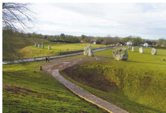
エーヴベリー遺跡の環状列石