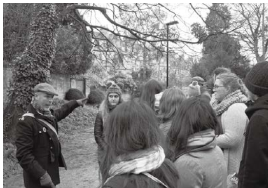
ツアーガイドの解説を受けながら、Bathの街並みを巡る

Bathは少し雨が降っていた。浴場見学までに少し自由時間があり、街をぶらぶらしていると300年前からある