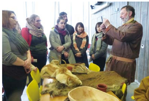
ストーンヘンジのデジタルセンターで当時の暮らしについて説明を受ける

歴史を学ぶ上では、博物館・美術館資料だけではなく、実際の地理的背景との結びつきを考慮することが重要になる。そのような認識に基づき、ロンドン滞在中は、イングランド南西部の歴史文化遺産を訪問する機会を積極的に設定した。ウィルトシャー州に所在する世界的に著名なストーンヘンジ、エーヴベリー遺跡を訪問し、新石器時代の文化や生業、ランドスケープ等について学んだ。また、これらの史跡では、訪問者へのアプローチ方法や展示物の構成等の違いについても議論を行い、理解を深めた。この他に、サマセット州バースを訪問し、ローマン・バス遺跡等の歴史文化遺産を見学した。ロンドンでは、ロンドン塔、ミトラス神殿遺跡等を訪問し、英国の歴史について理解を深めた。受講者間では毎晩、訪れた博物館・美術館や史跡について議論を交わし、歴史文化遺産の意義を考える機会を持った。