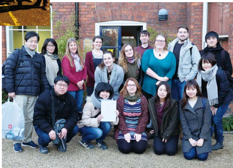
全プログラム終了後、セインズベリー日本藝術研究所前にて