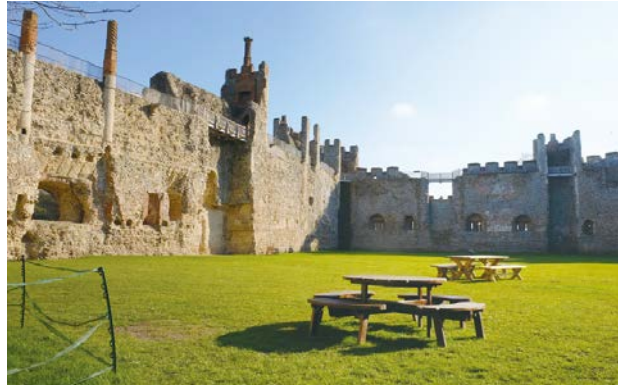
フラムリンガム城