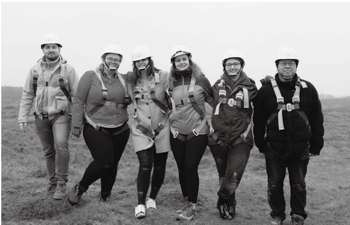
グライムズ・グレイヴス遺跡にて