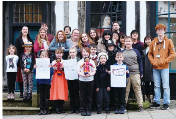
人形劇を披露してくれた歴史クラブの子供たちと