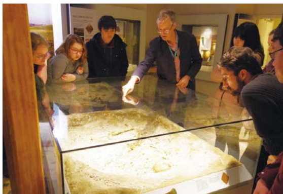
ウィルトシャー博物館館長による説明