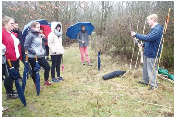
投槍器、プーメラン、弓矢などの説明を受け、体験実習に臨む

プログラム期間中には歴史文化遺産に関するイベントへ参加する機会もあった。セットフォード博物館では、地域の歴史クラブに所属する小学生の人形劇を見る機会があり、その土地の文化がどのように継承されているのか実感できた。ノーフォーク州セットフォードを中心とするブレックランドは、長野県長和町と、遺跡を中心とした国際交流を行っており、それらに関連した展示や活動等についても説明を受けた。日本と英国の文化交流の一端を垣間見るとよい機会となった。また、プログラム期間中に実施された本学のホームバーク博士による出版記念イベントにも参加した。ロンドンの書店で開催されたイベントには大勢の方が参加しており、日本の漫画文化に関する海外の関心の高さを知ることができた。