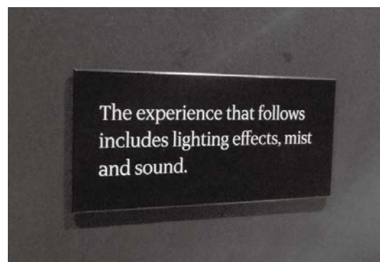
ミトラス神殿遺跡では照明や霧、音声を用いた演出がなされた

Bloomberg financed both the museum and the latest digs onsite without disclosing the costs (Pickford 2017). However, you only need to enter the museum to see that no expense was spared. This is clearly reflected in the visitor-experience: Spaces are wide, and exhibitions carefully chosen and displayed so as not to overwhelm the viewer. The exhibition guide booklets are printed on thick, glossy paper and the space itself is beautiful: white, high-ceilinged and with large glass display cases. Visitors are given individual tablets upon entering, with which they can learn at their own pace about the artefacts on display. Even the toilets are well and beautifully-designed- This is a museum designed to promote a high-quality interaction with the site; visitors are not overwhelmed with information and are encouraged to immerse themselves with the Temple via the use of sensory tools such as apps, tablets, and the audio-visual reconstruction centred around the archaeological remains.