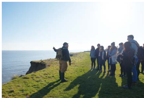
ヘイズバラにて、発掘担当者から直々に説明を受ける参加者たち