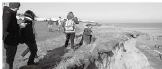
ヘイズバラ遺跡にて。海沿いは急速なスピードで侵食がすすみ、切り立った崖になっている

At Happisburgh (correctly pronounced Haze-bruh, because Norfolk town pronunciations are odd), we