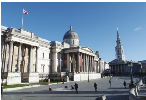
ナショナル・ギャラリー