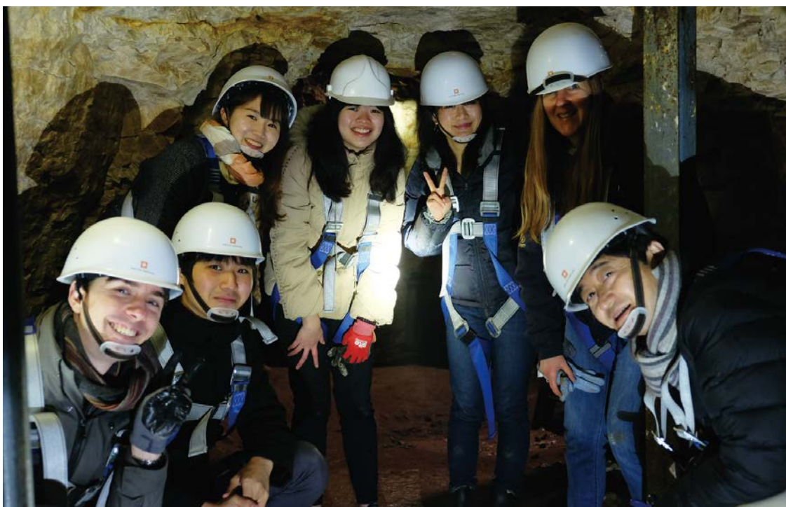
グライムズ・グレイヴス地下坑道内にて