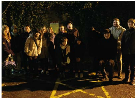
歴史ある街ノリッチにて、日く付きの場所を巡るゴーストツアーにも参加した