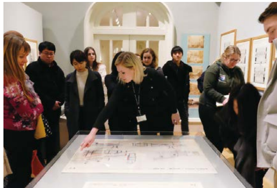
ノリッチ城博物館の企画展にて、図面を見ながら博物館の成立過程について知る