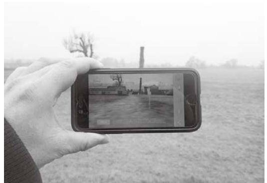
Caistor Roman Townにて。スマホをかざすと当時の町並みが再現される

午後はCaistor Roman Townを訪れた。あいにくの雨であったが、草原のような遺跡の中を、わずかに残って