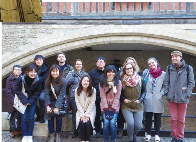
ロンドン塔 Traitor's Gateにて