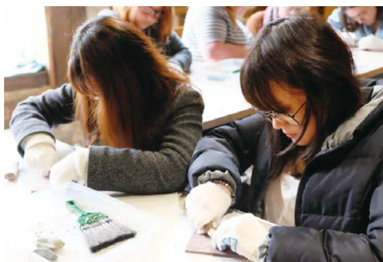
セットフォード博物館での石器製作体験