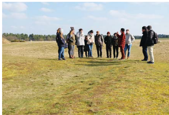
サットン・フー遺跡にて