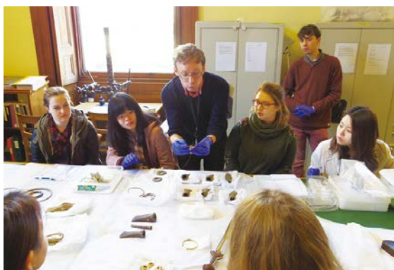
大英博物館で学芸員から収蔵品の解説を受ける参加者