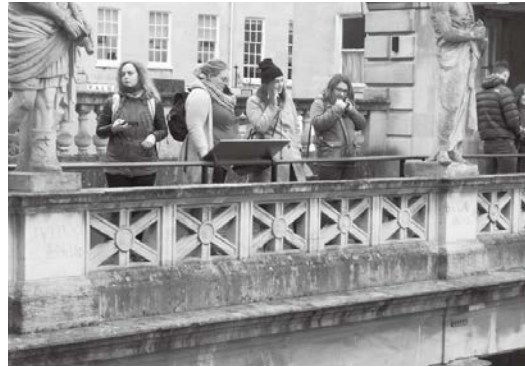
ローマン・バス遺跡では、小型端末を用いた各国の言語による音声ガイドが用意されていた

The Mithraeum also makes the public aware of the stratigraphy of the site by writing the events that