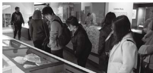
ロンドン博物館の展示

The Museum loses its chronological trajectory by the early medieval and start of the medieval (Norman). The mix of ideas is evident; there is a reconstruction of an Anglo-Saxon homestead, visitor-led audio with the gobblets of spoken 'Norman' and 'Middle English' amongst others and an obvious visual change in ceramics. Interpretively this fits the pre-made concept of Early Medieval and the layout for this mini-display reflects it but does little to change or add to what the 'average' visitor knows. The display lacks information on the Vikings despite Lundenwic being still an active centre of commercial trade and