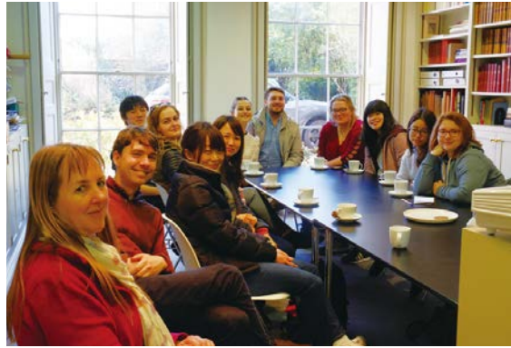
セインズベリー日本藝術研究所でのオリエンテーション

ノリッチ滞在中は、近隣地域の歴史文化遺産等をバスで巡った。訪問した史跡は、ノリッチ大聖堂、グレート・ホスピタル、ヘイズバラ遺跡、ウエストラントン海岸、ケスター遺跡、キャッスル・エイカー修道院跡、セットフォード修道院跡、グライムズ・グレイヴス遺跡、サットン・フー遺跡、フラムリンガム城等である。グライムズ・グレイヴス遺跡では、学芸員の案内のもと、新石器時代のフリント採掘坑を見学し、当時の人々の暮らしぶりに思いを馳せた。また、ヘイズバラ遺跡やケスター遺跡で