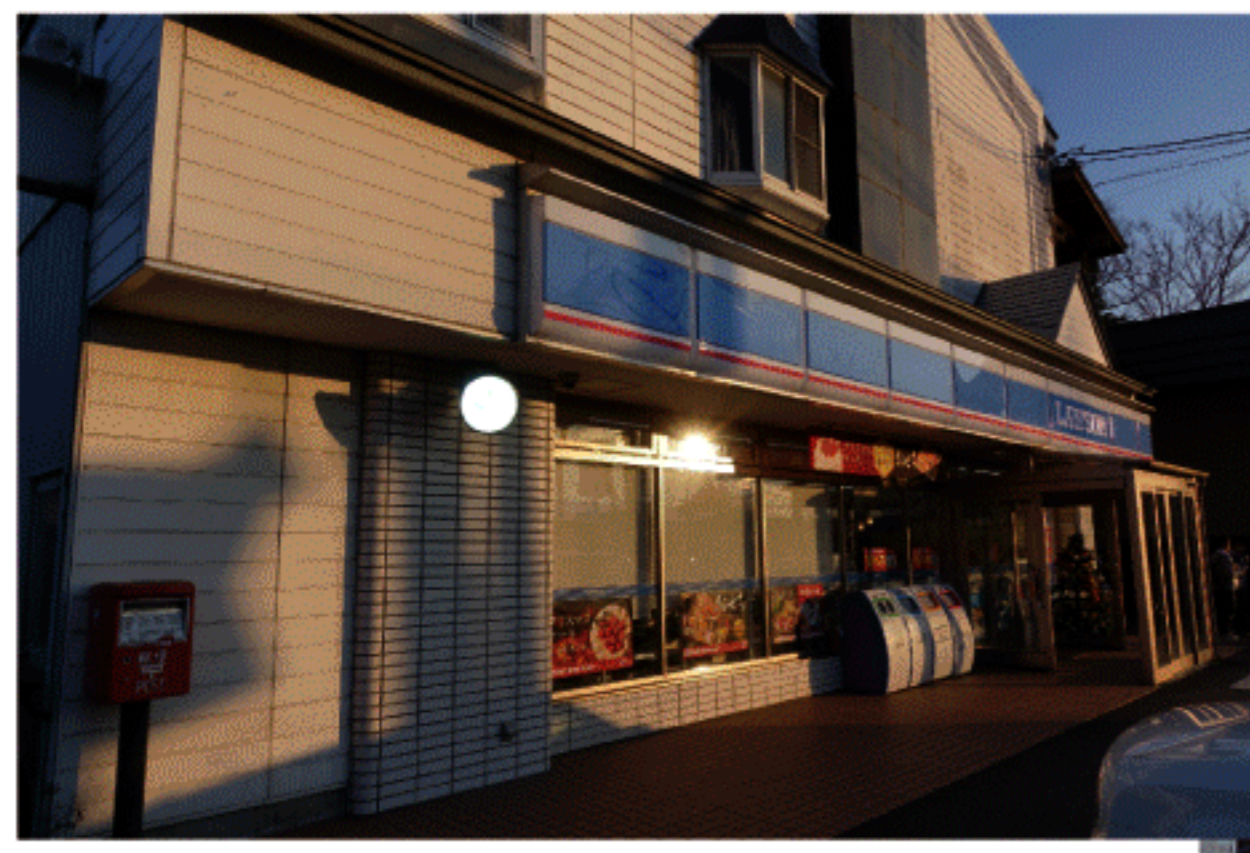
村内のコンビニエンスストア