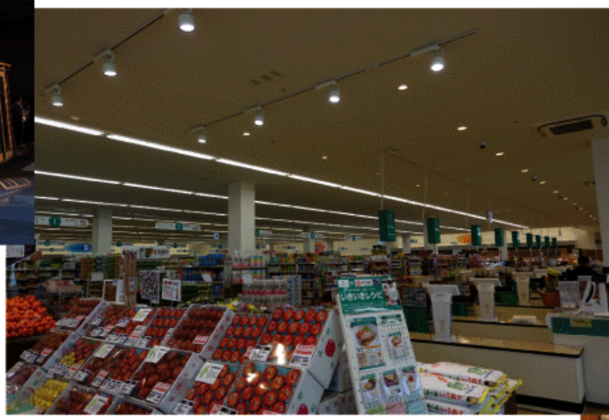
飯山駅前の大きなスーパー