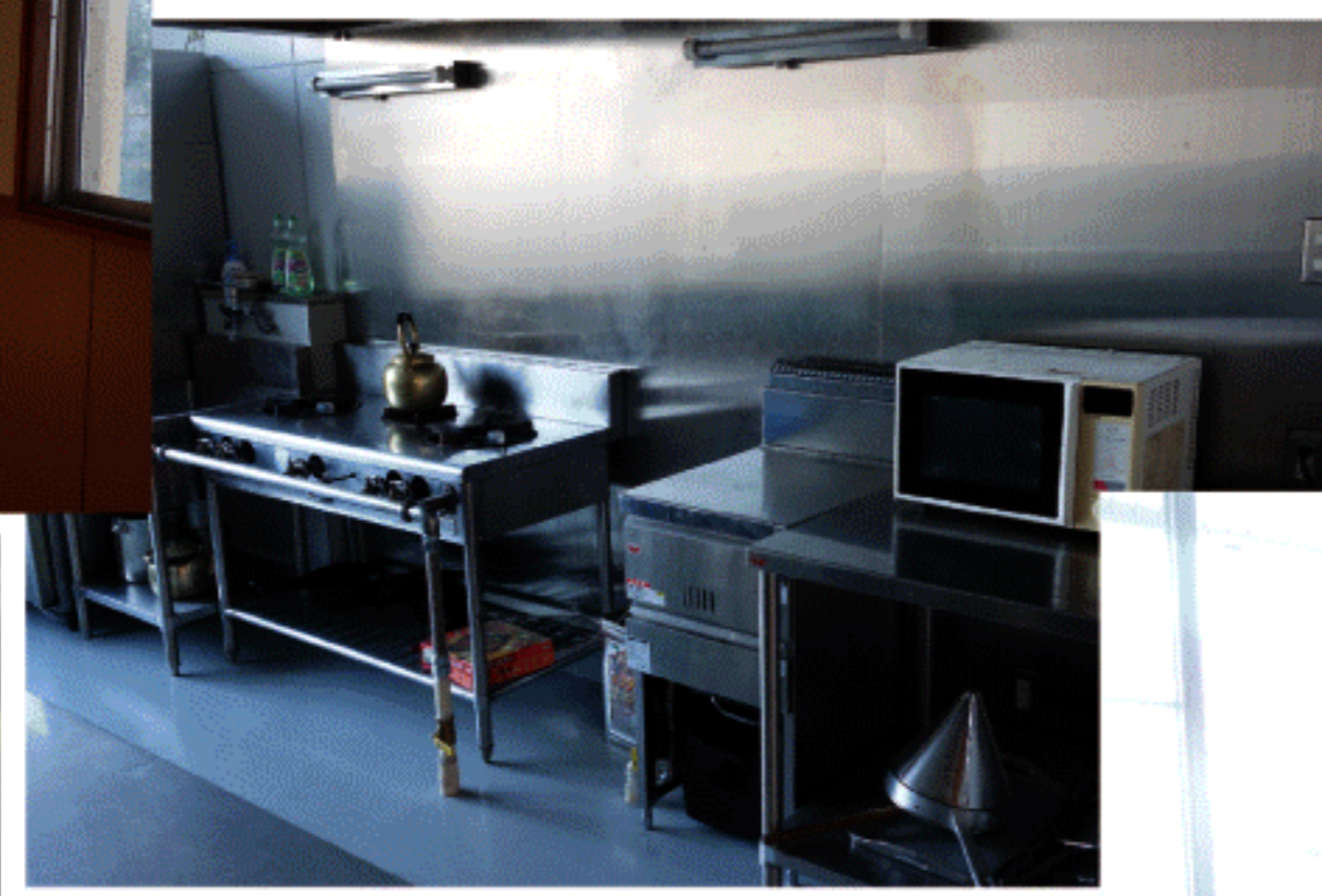
農村交流館キッチン