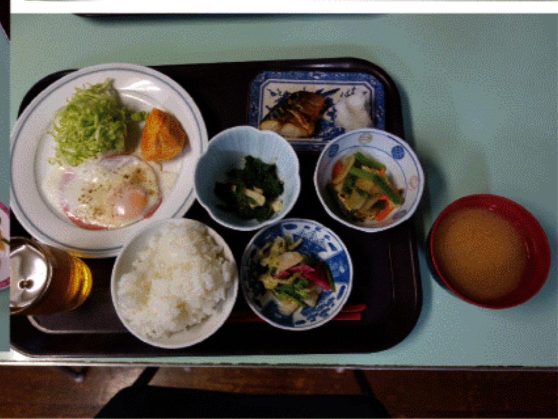
民宿の場合の朝食 (例)