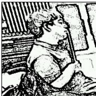
図 1: 指揮棒の位置

しかし、17 行目の Y の発言によって問題が解決していない可能性が示される。「イーウィ (.) ウィー E」は独特のリズムで発話されている。この直後の「ビ (.) ビー. B」は、7 行