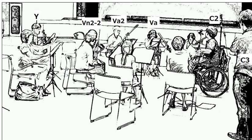
図2: 人物の位置関係