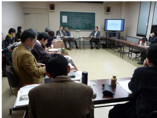
ラウンドテーブル当日の様子