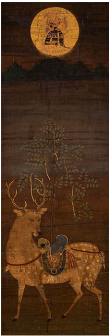
「春日鹿曼茶羅」 (西城戸町所蔵)