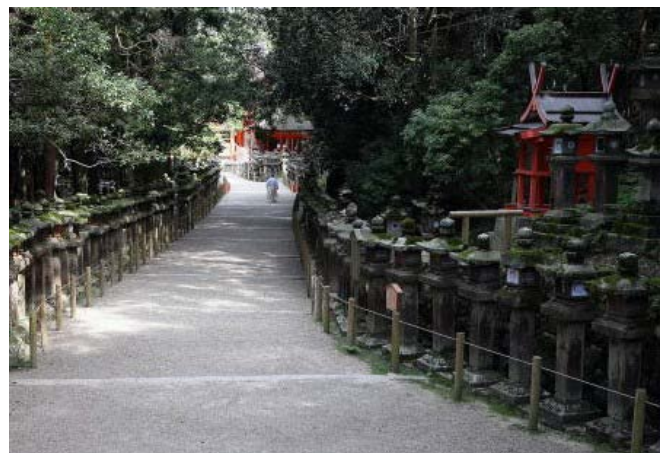
春日社境内、大宮と若宮を繋ぐ御間道に並ぶ石燈籠

こうした講衆の存在は、春日社の石燈籠などにも多くその名を留めている。石燈籠は一の鳥居付近から諸末社に至る広い境内の参道両脇に数多建てられ、年二回(二・八月)の万燈籠の時期には本殿内の吊燈籠と共に燈火されて厳かな雰囲気醸し出す。これらはいずれも寄進によって建てられたもので、押上町(東大寺大仏殿西側)や木辻子町(今の東・西木辻町、元興寺西南)など奈良町内の春日講衆も銘文に名を残している。これらの燈籠は近世末期から近代にかけて震災で多く倒壊したというから、かつては中世以来の春日講中の寄進によるものが更に多く立ち並んでいた事であろう。