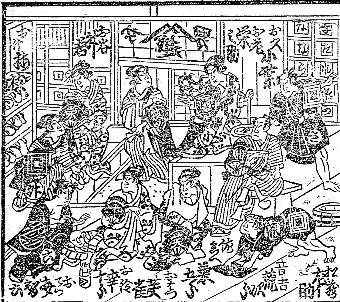
二重目下金屋の賑わいの様子