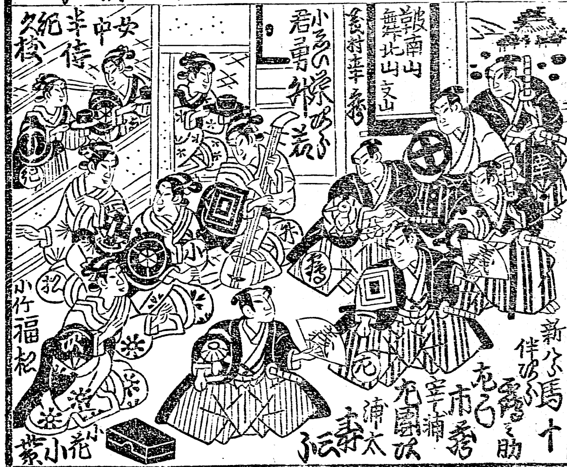
五重目下金屋の賑わいの様子