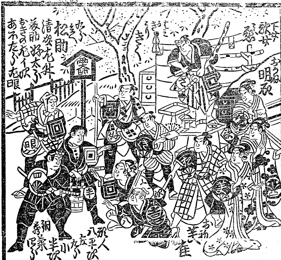
四重目下金屋の賑わいの様子