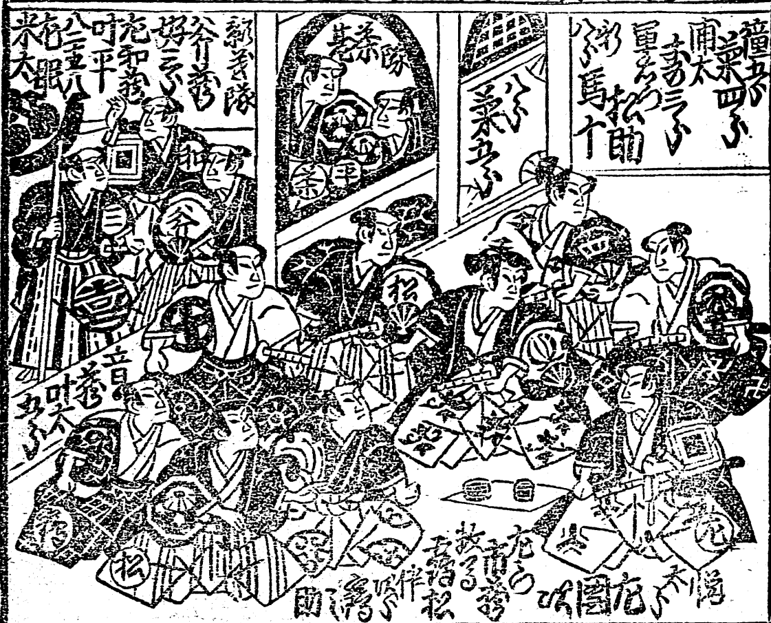
三重目下金屋の賑わいの様子