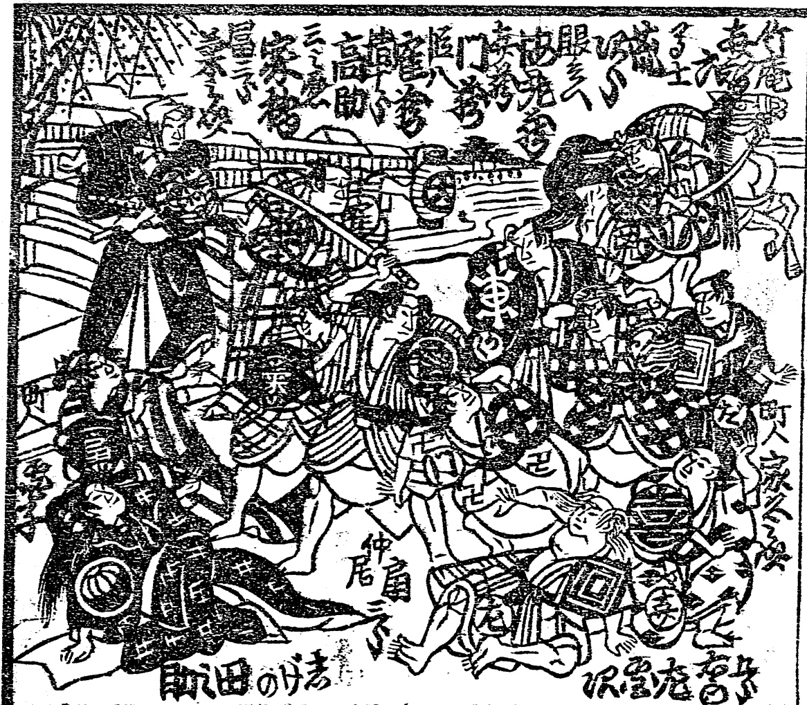
三番目下都下中田場の場