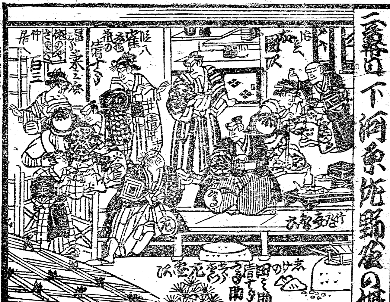
一番目下河原佐野倉の場