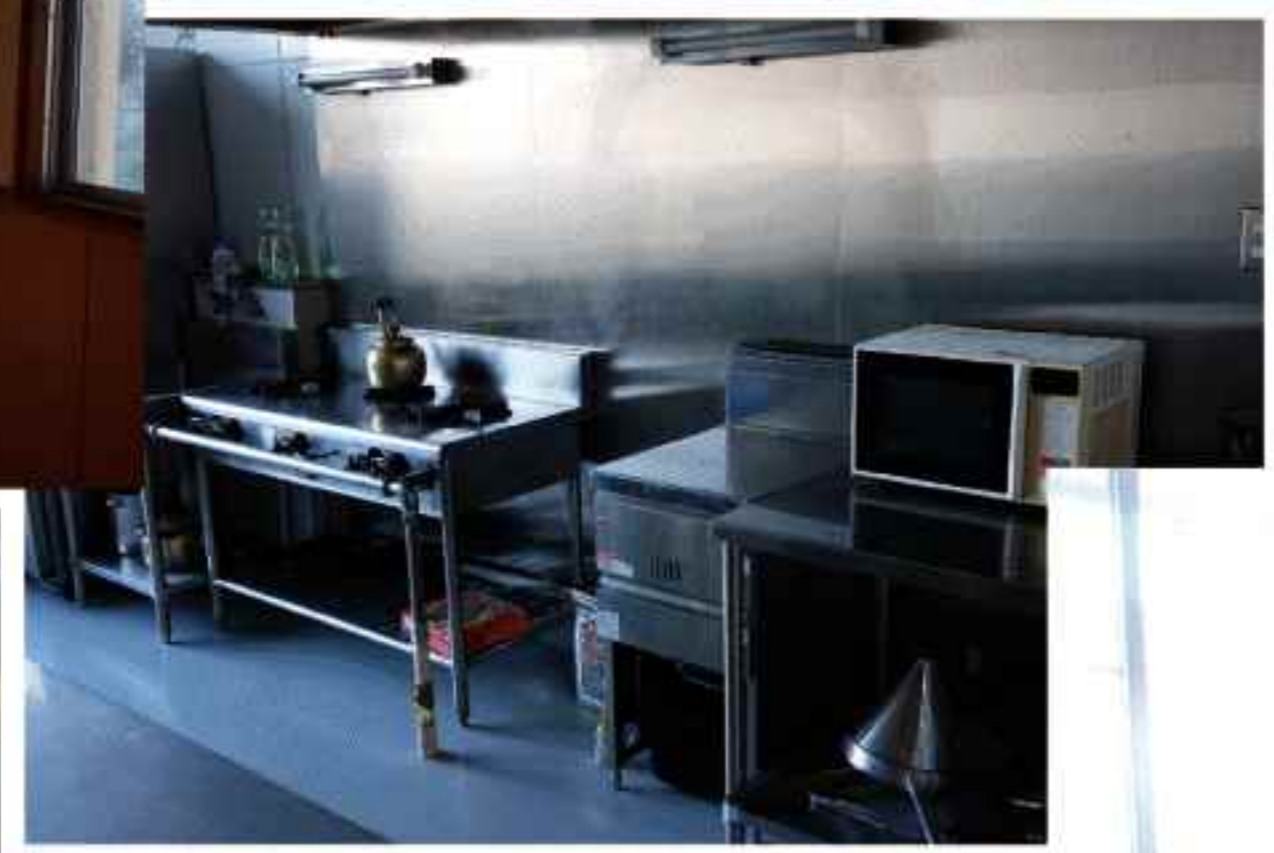
農村交流館キッチン