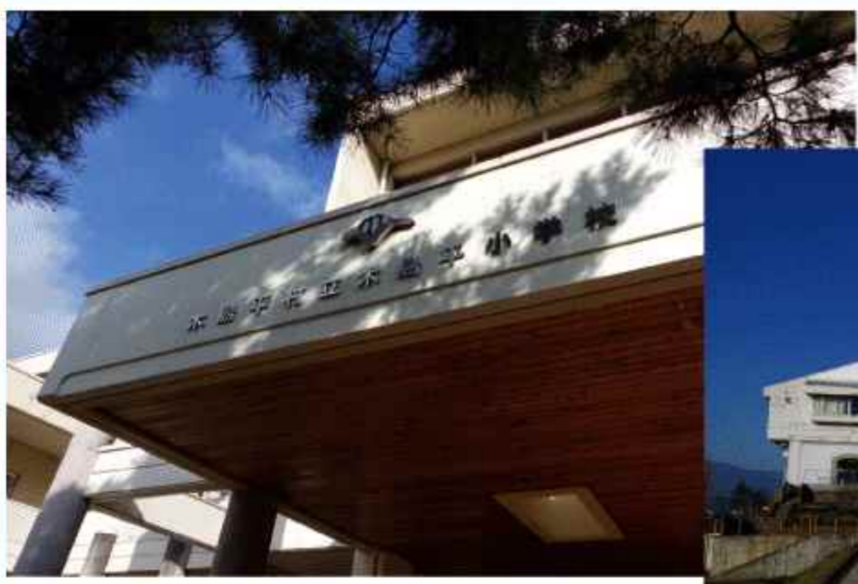
木のぬくもりが感じられる 木島平小学校