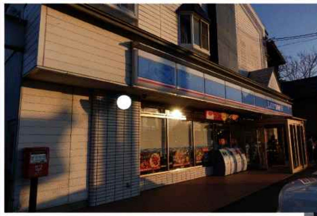
村内のコンビニエンスストア