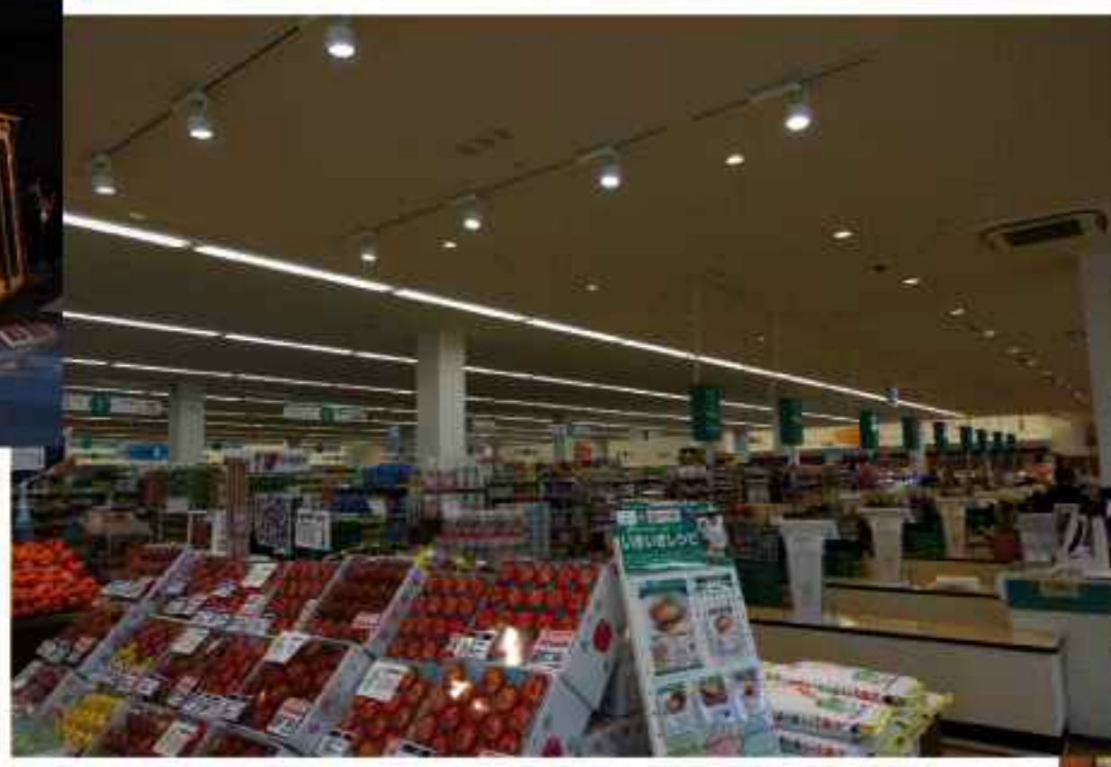
飯山駅前の大きなスーパー