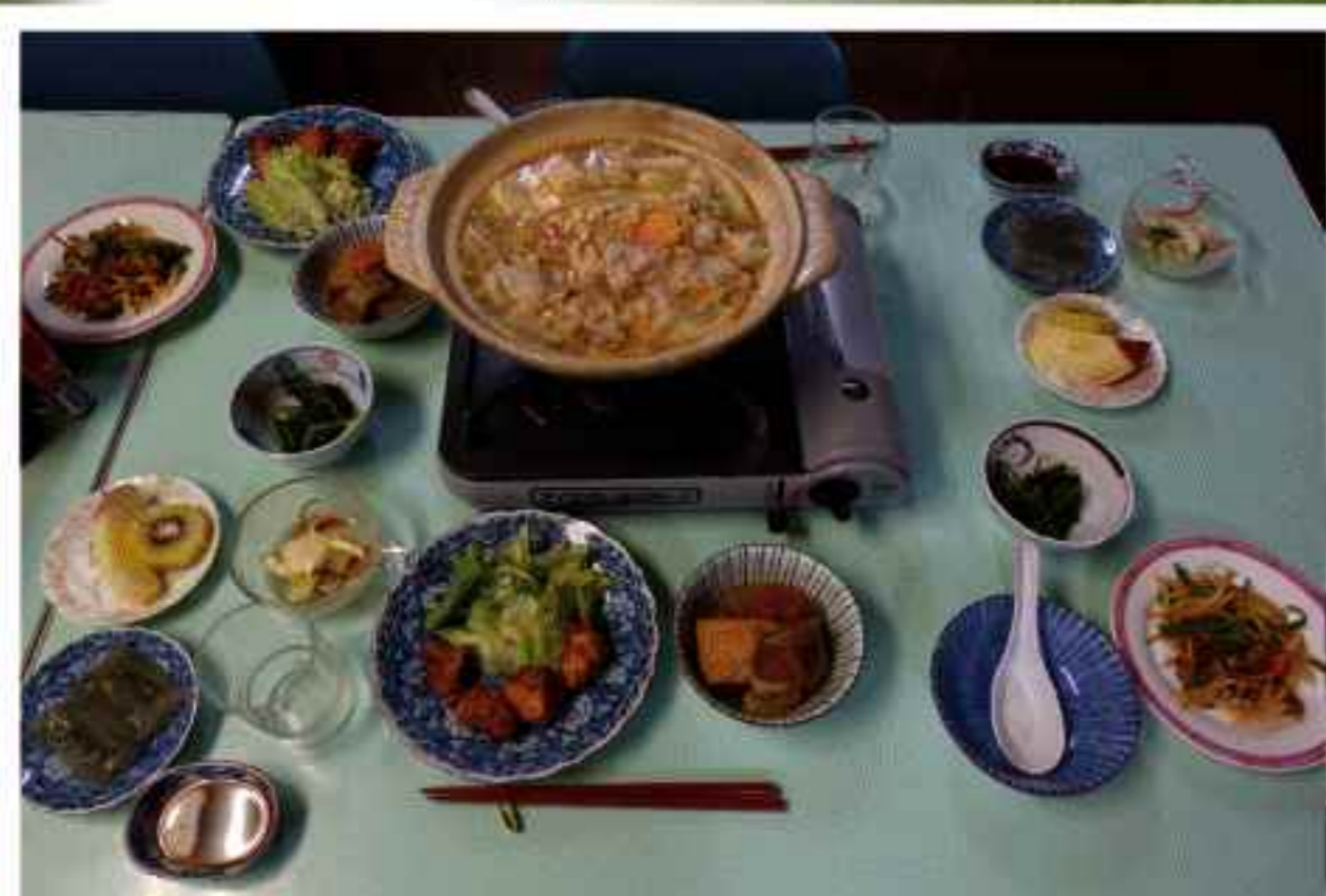
民宿の場合の夕食 (例)