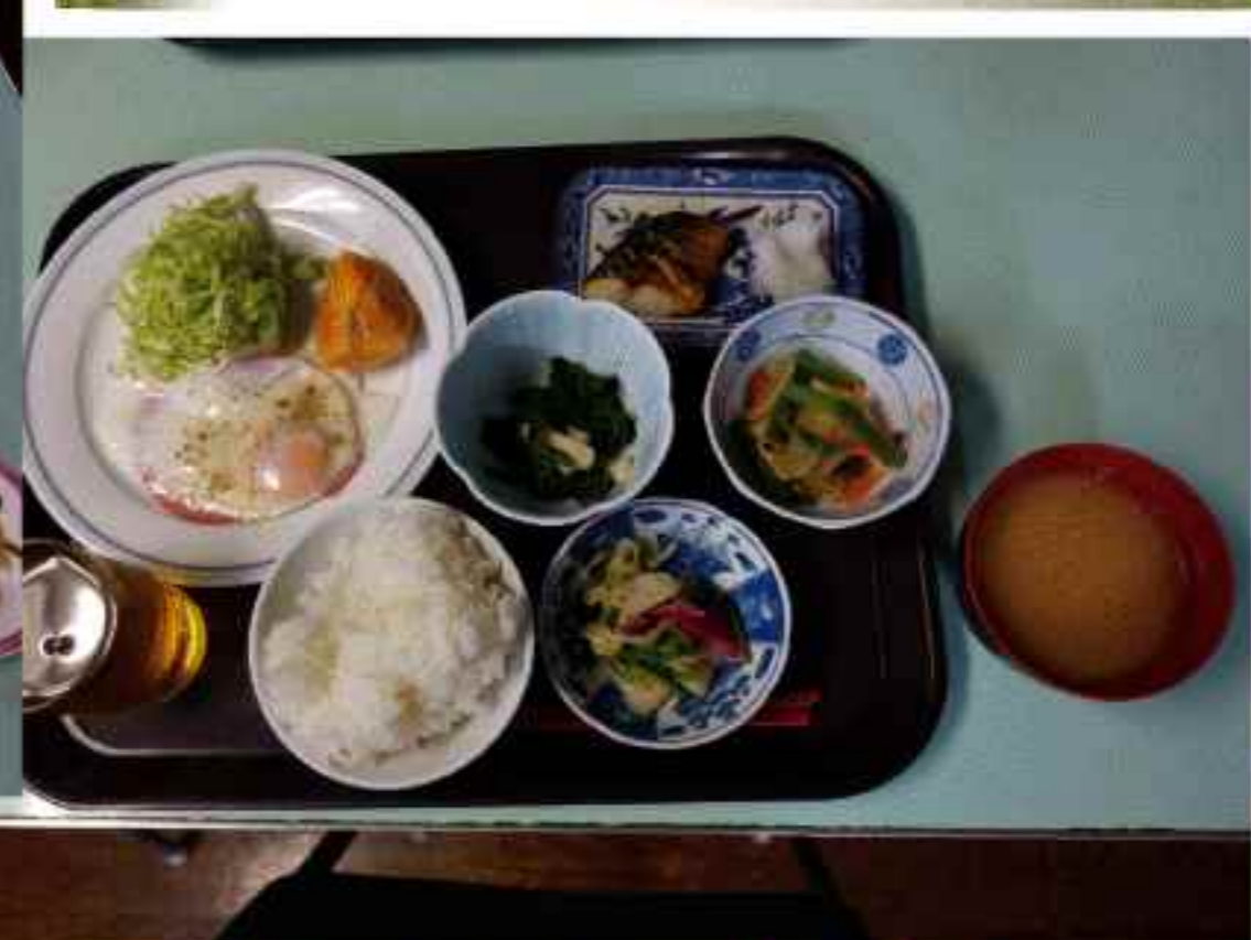
民宿の場合の朝食 (例)