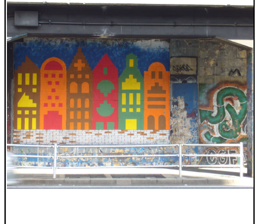
法文二号館内 部室壁面