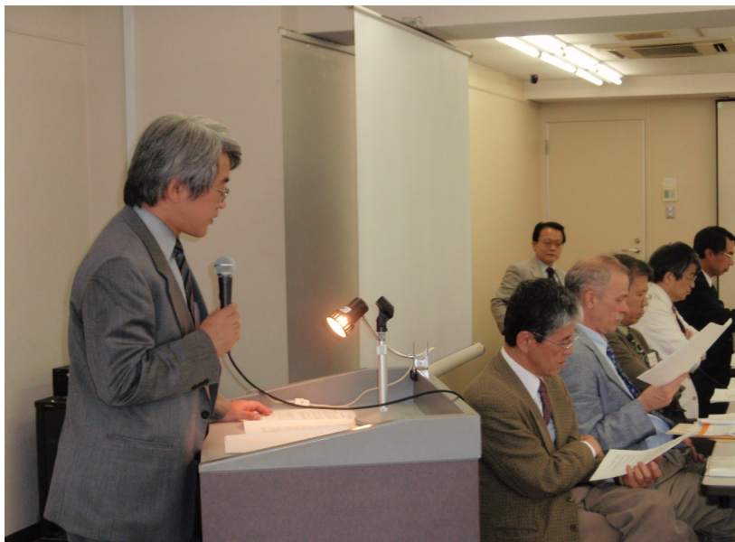
第53回国際東方学者会議での発表風景

【Transactions of the International Conference of Eastern Studies, No. 53, 2008, pp. 142 - 146.】